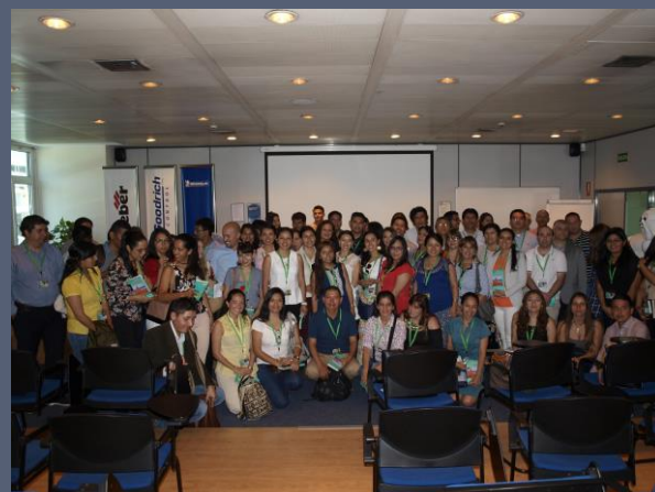
Visita a Michelin, grupo fabricante de neumáticos de los más importantes del mundo