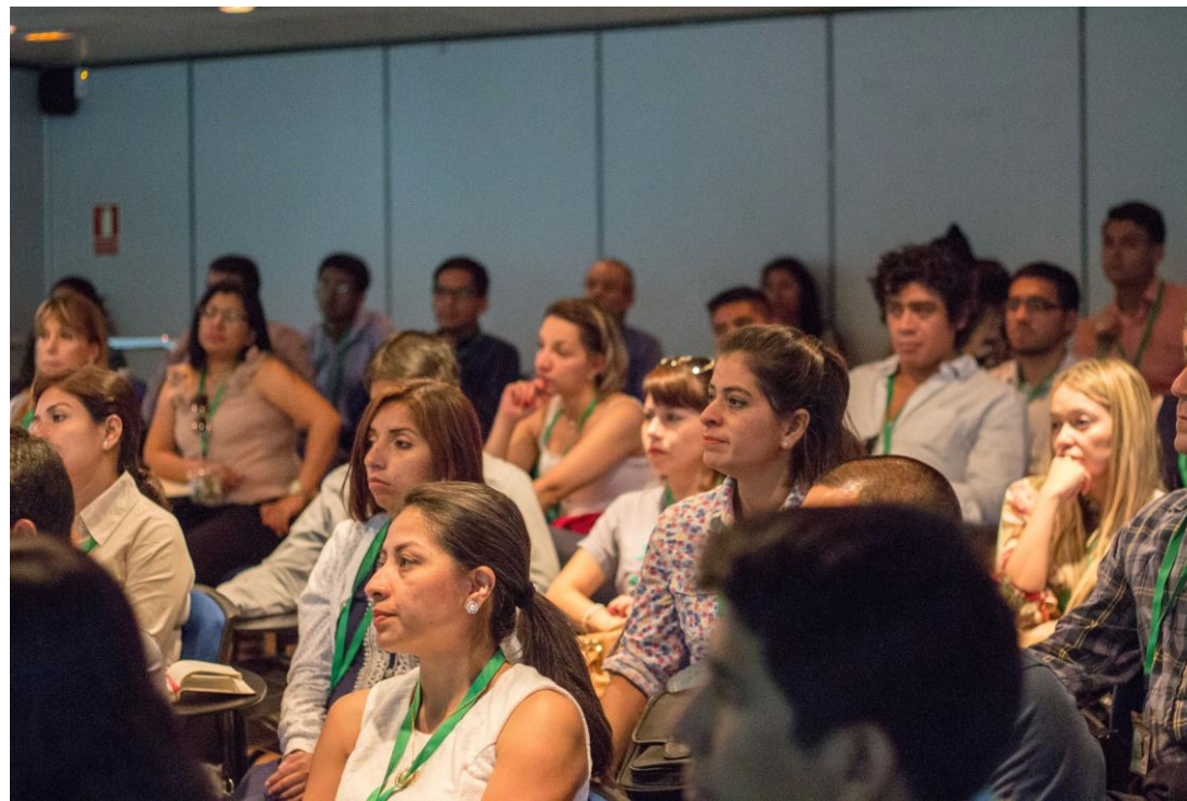
Alumnos de la Estancia Internacional de Desarrollo Directivo durante la visita a la empresa Michelin.

Los alumnos de la Estancia Internacional han asistido a las mejores Máster Class y visitado muchas de las más prestigiosas empresas nacionales e internacionales con sede en Madrid