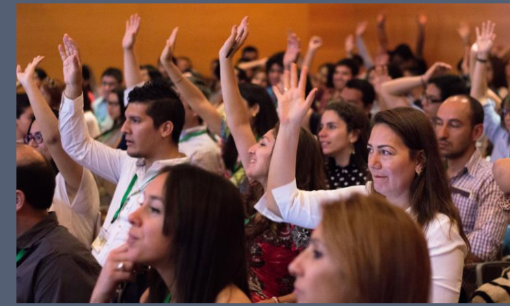
Los alumnos de la Estancia Internacional de Desarrollo Directivo durante la ponencia en el Ayuntamiento de Tres Cantos