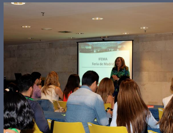
En la sala de actos de IFEMA, la Feria de Madrid, entidad que organiza ferias, salones y congresos